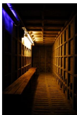
L'Abri antiaérien