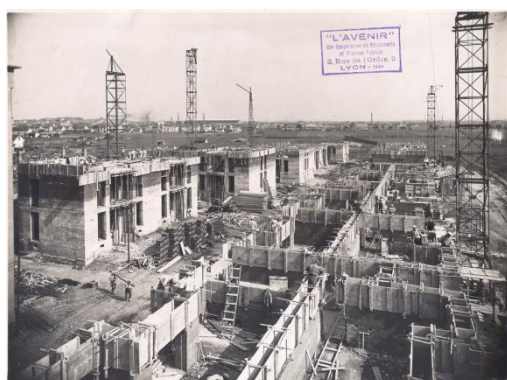
La construction des Habitations à Bon Marché, LARHA / Archives départementales du Rhône.